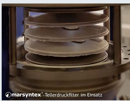
☉ marsyntex ® -Tellerdruckfilter im Einsatz