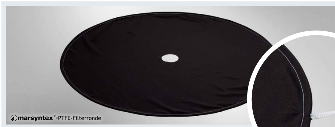
☉ marsyntex ® -PTFE-Filterrunde